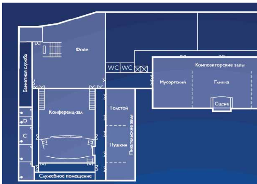
СХЕМА РАСПОЛОЖЕНИЯ ЗАЛОВ КОНГРЕССА: